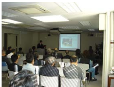
出展技術プレゼンテーション