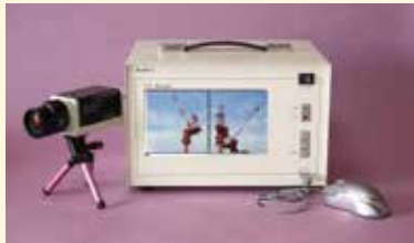
テレビ画面上に検知センサーを設定する新方式のセンサーです。

本システムは監視カメラと画像処理装置TVセンサーで構成される。TVセンサーに付帯したマウスでテレビ画面上にセンサドット(点)を配置できる。センサドットは、重機や車両、列車、船舶、土石流など移動物がセンサドットに触れると自動検知する。従来の検知センサーは現場に設置するがTVセンサーはテレビ画面上にセンサエリアをつくる。そのため空や海、川、山など監視カメラで映せる範囲はどこにでもセンサエリアをつくることができる。