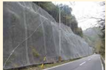
平成24年度三重県伊賀建設事務所管内実績写真(12650m)

ネットワンの構造は、ワイヤひし形金網・硬圧金網、ワイヤロープ、アンカーおよび、緩衝装置などで構成された高エネルギー吸収型落石防護網工法です。緩衝金具を備えることで、落石発生時、最大4000kJの落石エネルギーを吸収し、落石の跳躍を抑え、エネルギーを減衰させ、安全な場所(法尻の余地等)まで誘導します。ポケット式では、斜面状況、落石の規模により、「標準タイプ」・「ワイドタイプ」・「ミニタイプ」を選択できます。