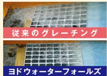
水理試験状況(勾配10パーセント、1秒あたり3リットル)