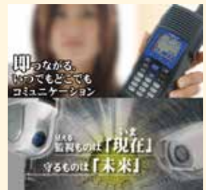
災害・緊急時などいざという時にも使える通信システム

災害・緊急時などいざという時にも使える広域通信システム (mcAccess e無線)や通信料が不要な業務用簡易無線機、免許・資格不要の特定小電力トランシーバーや多人数同時通話システム等、各種無線機。大切な財産をお守りする最新の防犯監視システム。フルHD監視カメラ、ネットワークカメラ等を展示、ご希望に応じた御提案を致します。