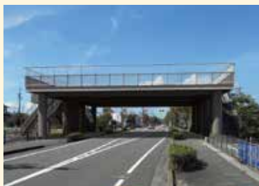
完成イメージCG(吉田町・K街区)

最大級の津波と地震に同時に襲われても、各部材が弾性域(除荷すると元に戻る状態)に収まる設計としています。また、液状化や漂流物の衝突荷重を考慮し、より安全な構造物として設計しました。設計上の考え方、準用すべき基準、整備上の法律的な制約など解決すべき課題に対しては学識経験者、国土交通省、静岡県、吉田町で構成された委員会において議論いただき、「標準仕様設計基準(案)」策定に至りました。