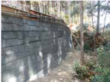
三重県度会町施工実績

パラメッシュは、ポーラスコンクリートブロックと背面にL型の溶接金網を敷設して、中詰材として砕石を投入して構築する逆台形垂直擁壁です。ブロックが、ポーラスコンクリートであることから、壁面全体から円滑に湧水、雨水を排出します。逆台形ということで掘削幅を低減でき(=工期短縮、コスト縮減)、山間部の狭い道路や通行止めをしたくない場合等に有効です。また部材が軽量で作業性が良く、大型重機が入れない場所等でも施工可能です。