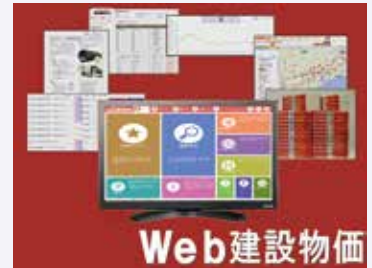
Web建設物価( http://www.web-ken.jp )

月刊「建設物価」に比べ圧倒的な価格情報(約1.6倍)を収録した「Web建設物価」。キーワードや分類から簡単に資材価格を探すことが出来ます。また、資材の写真や解説、約10年分の月刊「建設物価」バックナンバーを電子書籍等で完備。さらに運賃積算時に必要な距離・ルートを算出するMAPサービスも利用可能。その他Web版ならではの便利機能満載です!!