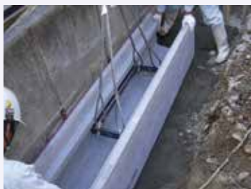
構造物脇での施工状況

CD側溝は、従来のU型側溝をコストダウンするために開発した側溝です。蓋掛り部が内側に張り出しておりますので、蓋のサイズが小さくなり、新設工事においても、ふたの掛け替え工事においても、コストダウンが可能です。側壁が垂直になるため、転圧不良による舗装の沈下が生じません。内吊施工が可能なので、官民境界や構造物脇に於ける施工が容易です。また、高さが高い製品も用意しており、可変側溝の代わりにも使用できます。