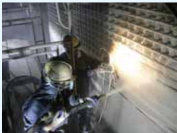
ポリマーセメントモルタル乾式吹付状況(時速200kg/h)

既設コンクリート構造物に対して、補強鉄筋とポリマーセメントモルタルの乾式吹付け工法による耐震補強工法。ポリマーセメントモルタルで巻立てることにより、RC巻立てよりも薄い厚さで巻立てられるため、河積阻害に対しての問題に対応できます。一度に50mmの厚さで吹付けることが可能で、施工性に優れ工期を短縮することが可能です。同時に、圧縮強度62.5Nなど、高い品質を有します。