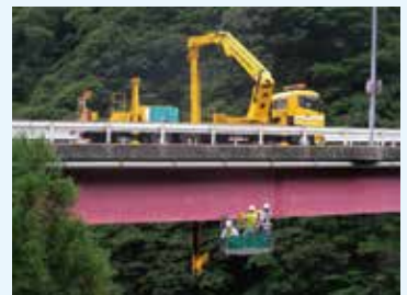
橋梁検査車を利用した橋の病気(損傷)の診察(診断)状況

道路橋の病気(鋼材の腐食や亀裂、コンクリートのひびわれやうきなど26種類の損傷)について、それぞれの橋梁の特性(橋梁の年齢、構造形式、地域環境、補修履歴など)を考慮して診察(診断)を行って処方箋(対策)を作成し、道路管理者に適切な維持管理上のアドバイスを行う。