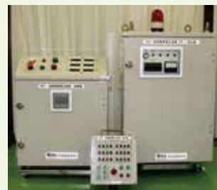
放電破砕装置1式 (ESG-3K1) 合計重量139kg