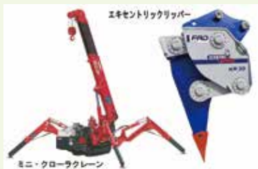
ミニ・クローラークレーン エキセントリックリッパ

転倒防止装置付きミニ・クローラークレーンは吊上げ性能2.93tでありながら走行時最大幅60cmとコンパクトなので狭い現場へも自走でき、さらに200V電動モーターを使用すれば排気ガスがゼロなので屋内作業も可能。エキセントリックリッパは最新の振動増幅技術で打撃機構のない効率的な破砕・解体作業とバケット作業並みの低騒音を実現。また可動部が密閉構造のため外部環境に影響されず、メンテナンス期間の長い低維持コストを達成。