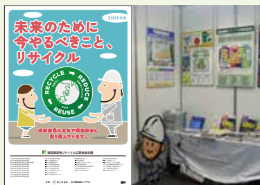
■2013年度広報用ポスター ■2012技術展示会の様子

建設副産物リサイクル広報推進会議は、各地方建設副産物対策連絡協議会(国土交通省・都道府県・政令指定都市等で構成)と、建設業・建設副産物処理業団体等の会員で構成された団体です。普及・啓発活動として、技術発表会・技術展示会の開催や建設リサイクル広報用ポスターの作成、パネルの貸出等を行っています。また、3R推進に功労した団体を各表彰制度に推薦・紹介し、建設リサイクルに携わる実務者の方に有益な情報や刊行物を提供しています。