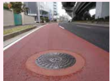
平坦で品質の良い舗装が完成。

地域や利用者の視点に立った道路が求められているなかで、ライフラインであるマンホール鉄蓋などは道路上で多くの問題となっています。道路の目的は「何人も安全に通行できること」です。円形に舗装を切断してマンホール鉄蓋作業に対応してきた二十数年の経験と技術を生かし、舗装業者の皆様方に安心・安全に施工をして頂く為、コスト削減と工期短縮・平坦で品質の良い舗装ができ通行車両による騒音・振動のない施工方法について紹介致します。