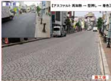
群馬県高崎駅周辺舗道、ストリートプリント2050m 2 施工

日本の国土は、いたる所にアスファルト舗装がされています。現行のアスファルト舗装を利用し美しい街並みを創っていく。今、使われているものを利用することで余分な廃棄物を出さない。アスファルトは数々の優れた長所を誇る舗装材ですが「劣化しやすい」「見た目が貧弱」という難点が付きもの。しかしストリートプリントを用いれば見た目は美しく耐久性に優れたアスファルト舗装が実現、アスファルトの欠点を解消し付加価値を創造する最先端工法です。