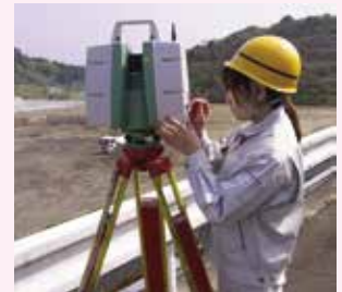
3Dレーザースキャナー作業風景

「3Dレーザースキャナー」は、短時間で全周囲360°×上下方向300°の3次元空間を誤差わずか数mmで計測する高精度の測量機械です。弊社では図面のない既存構造物(建築物・プラント・インフラ等)の実測から、現況図面の作成までのサービスを提供致します。