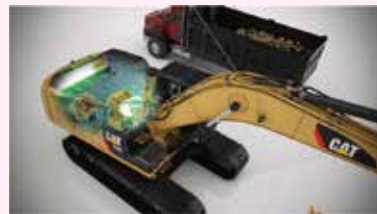
CAT次世代環境型ハイブリッド油圧ショベル「336ELH」

キャタピラーは排ガス4次規制に対応した環境対応型油圧ショベル「Eシリーズ」と最新型のハイブリッド油圧ショベル「336ELH」をリリースしている。さらにEシリーズ油圧ショベルには、最近注目度の高い「情報化施工」に対応する内蔵型純正システムであるCatグレードコントロール2Dガイダンスを搭載している。3次元への拡張性を備えたグレードコントロールシステムとCAT情報化施工技術の紹介を行う。