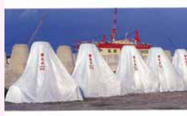
コマシート(ブロック専用養生シート)

コマロックは、主に河川、港湾、海洋における必要不可欠かつプラスαの製品を提供しています。消波、根固等の異形ブロックの製作現場におけるコンクリートブロック専用養生シート「コマシート」、コンクリート表面の気泡を少なくする剥離剤「コマコート」、ブロックの海上据付等の効率化を目的とした高強度の「コマストロングワイヤ」、汚濁、オイル拡散防止・海難防止など多目的に使用できる新しいバリケードフェンス「コマバリア」を紹介します。