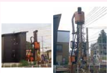
建物や架空線が近接する狭隘地での施工実施例です。

孔壁周辺に土砂や玉石等を圧縮するため、地上に出る削孔土砂が減り、スクリーロッドへの摩擦抵抗が少なく、硬質地盤を効率良く掘削できる工法です。掘削重機は従来のアースオーガーと比べ約半分の重量で、リーダーの高さは標準が9.95m、最低高は7.95mとコンパクトな機械なので、高さ制限のある現場や狭隘地等の施工に向いており、工期短縮、コスト縮減、周辺環境への影響抑制、安全性向上などが期待できます。