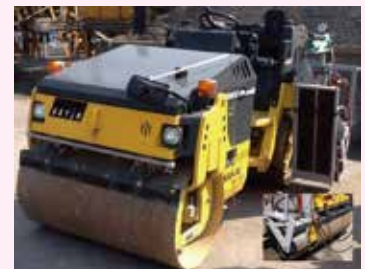
凸型溝アタッチメントを装着した4t振動ローラー

アスファルトを敷均したばかりの舗装面(表層面)に凸型溝アタッチメントを装着したローラーを走行させる事で、車道横断方向に深さ・間隔一定の凹型溝をつける。この凹型溝で通過車両に対し音や振動を発生させ注意を促す。既存の4t振動ローラー等に装着が容易にでき、注意喚起溝の施工以外でも凸型アタッチメント部分をジャッキで上げて他工種でのローラーの使用可能にしました。施工機械の調達が可能となりトータルコスト削減が可能。(特許出願中)