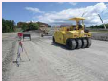
転圧マスター概要 計測レーザーより照射し表示板にカウント表示

盛土転圧を行う現場において、盛土断面に応じてあらかじめ設定した距離範囲内を通過する転圧機械にレーザー光を照射計測し、通過回数を自動計測して表示板に表示するシステムです。このシステムにより、従来の転圧機械運転手の記憶違い等による転圧不足による締固め不足や無駄な過転圧の排除を行い、施工管理の大幅な改善により盛土体の品質向上が期待できます。